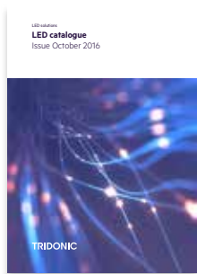
Solutions LED Catalogue produit