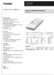
Fiches de données sur www.tridonic.fr , dans « Caractéristiques techniques »